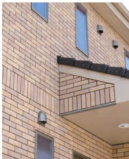
■使用タイルカラー CAB-200